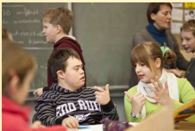
Нарушение интеллектуального развития