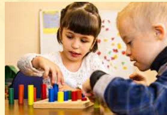
Задержка психического развития