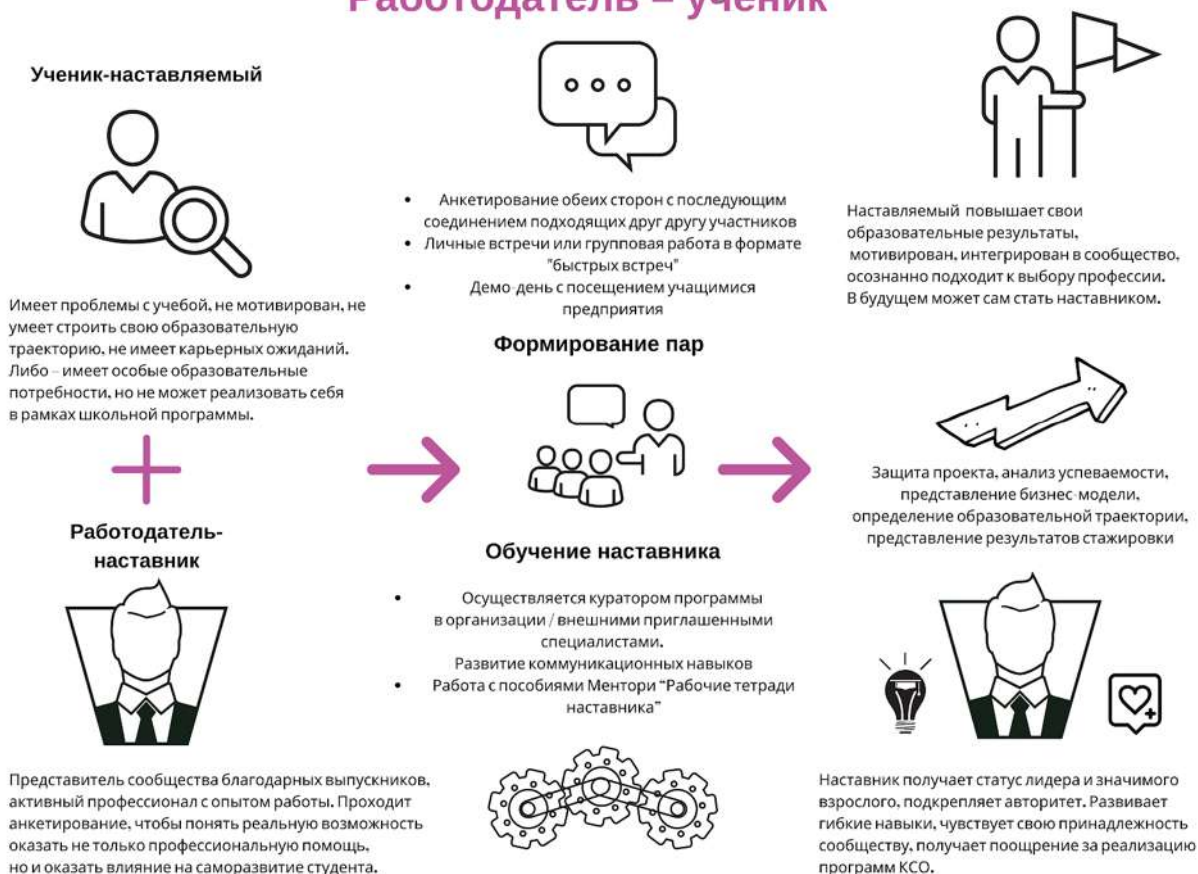
Рисунок 4. Графическое представление реализации программы наставничества по форме «работодатель – ученик».