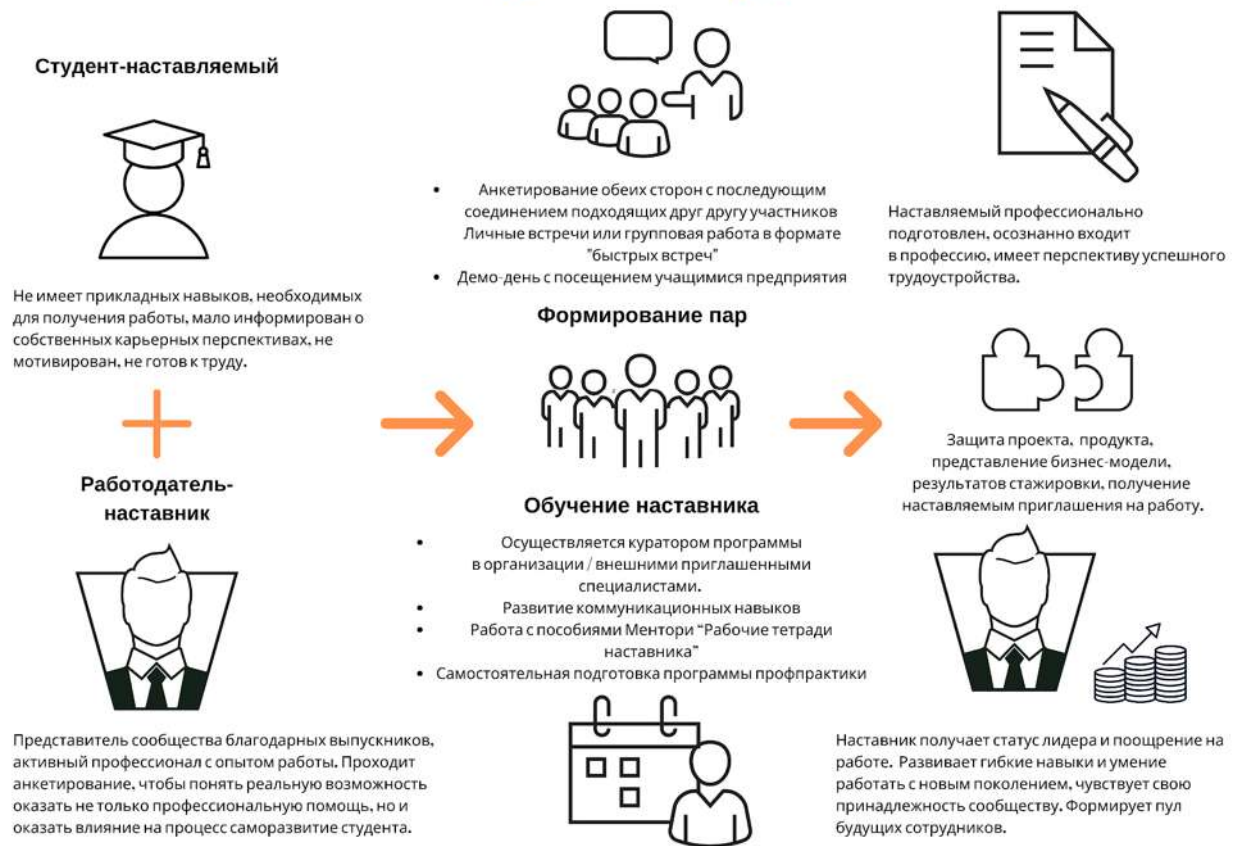
Рисунок 5. Графическое представление реализации программы наставничества по форме «работодатель – студент».