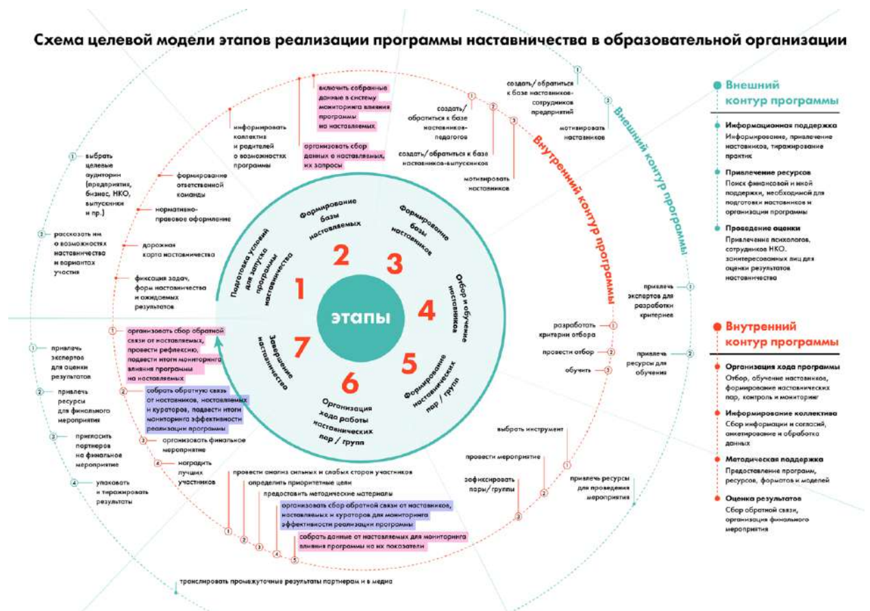
Рис. 6. Схема целевой модели этапов реализации программы в образовательной организации

Содержание каждого этапа, представленное в виде направлений работы с внутренним и внешним контурами, содержится в таблице 1 «Целевая модель этапов реализации программы наставничества в образовательной организации». В таблице 2 «Целевая модель программы наставничества в образовательной организации» представлены основные компоненты программы наставничества.