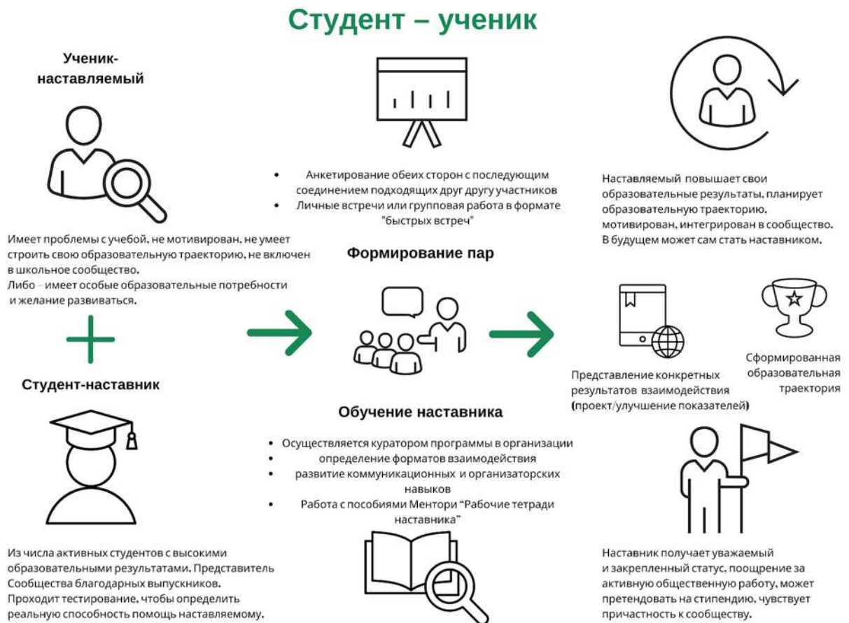
Рисунок 3. Графическое представление реализации программы наставничества по форме «студент – ученик».